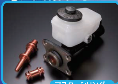
マスターシリンダー