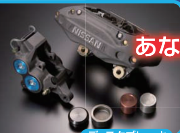
ディスクブレーキ