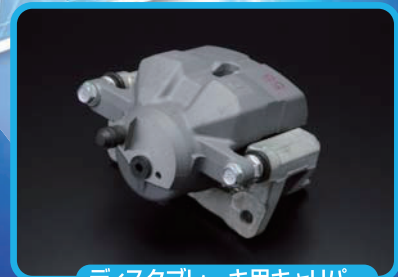
ディスクブレーキ用キャリパー